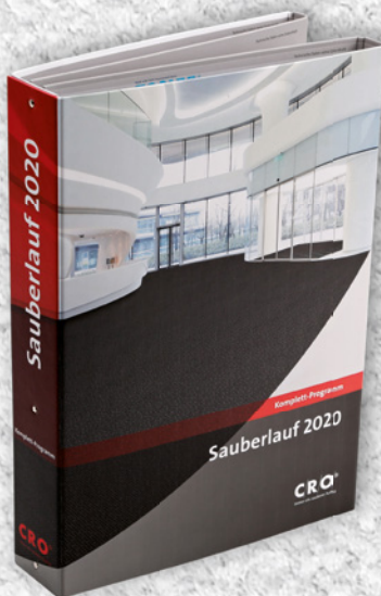
Musterkarte Kompletprogramm 2020

In den letzten 21 Jahren haben wir für C/R/O/ alles produziert, was man sich für einen Hersteller von Sauberläufen ausdenken kann. Hier nur ein kleiner Auszug unserer aktuellen Produktionen in 2017.